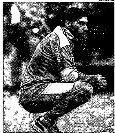
Técnico Abel Ferreira ainda não definiu os titulares do Palmeiras

Não há, no regulamento, qualquer previsão de que outros jogadores ou membros da delegação que tenham tido contato com os contaminados sejam afastados caso não testem positivo. Haverá exames antes e após cada partida que as seleções realizarem na competição. Haverá também a possibilidade de troca de três jogadores antes do início da fase final da competição, sem a necessidade do atleta estar machucado. Nesse caso não é preciso que o substituído esteja na lista provisória, ou seja, por ser qualquer jogador que o treinador entenda que deva ser chamado. Antes de começar o campeonato, e após 10 de junho, só poderá haver substituição em caso de lesão grave ou, como já citado, se houver testagem positiva para Covid-19.